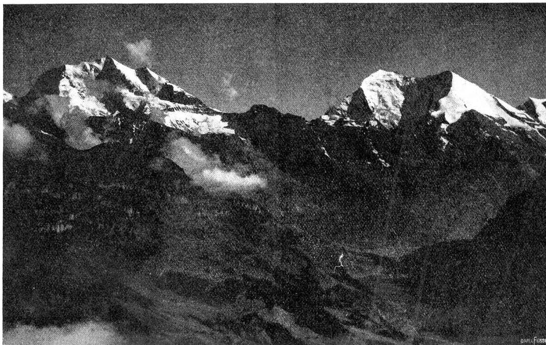
Blick vom Niesen-Kulm (2367 m) auf Doldenhorn, Balmhorn, Altels und Kandertal.

Was droben der Gipfel bietet, das brauche ich hier nicht aufzuschreiben; das weiß ja jeder Schüler. Auch daß die Luft, die nie ganz ruhig ist, auf 2367 Meter Höhe schon ordentlich an die Ohren beißt. Auch hierfür weiß die Bequemlichkeit Rat: sie setzt sich in das komfortable, prächtig