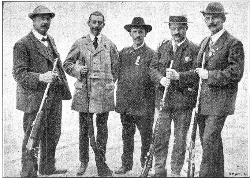
Die Schweizer-Schützen in Biarritz.

Diese Resultate, die bis jetzt noch nie erreicht wurden, machen uns stolz auf unsere Schweizer Match-Schützen. Ihnen kommt wohl in erster Linie das Verdienst des guten Rufes zu, den die Schweizer als Schützen im Auslande genießen, und der Respekt, den die Ausländer vor der Gewandtheit der Schweizer-Schützen überhaupt haben, dürfte zur Erhaltung unserer Unabhängigkeit nicht wenig beitragen. Mit einer einzigen Ausnahme (Turin 1898) sind die Schweizer in den 17 bisherigen internationalen Gewehr-Matches immer Sieger geworden.