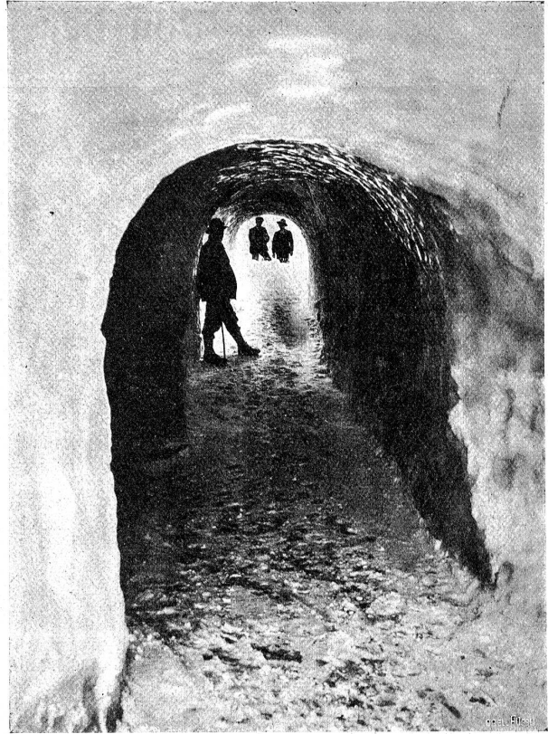
Von der Jungfraubahn. Gletschertunnel auf dem Wege zum Aussichtsplattform auf dem Jungfraujoche.

Ganz im Süden der Dischmaalp, gegen das Sertigtal hin, erhebt sich jetzt ein kolossaler Bau, das Kurhaus Klavadel. Das Dörfchen gleichen Namens ist ein idyllisches Nestchen aus lauter Sennhütten und Fremdenpensionen. Von Davos aus benutzen die Fußgänger gewöhnlich den Waldweg, um zu dem Weiler zu gelangen, und dieser Pfad wird öfters durch einen Wildbach unterbrochen. Die Einschnitte sind jedoch überbrückt, und bei einem solchen Punkt begann unsere