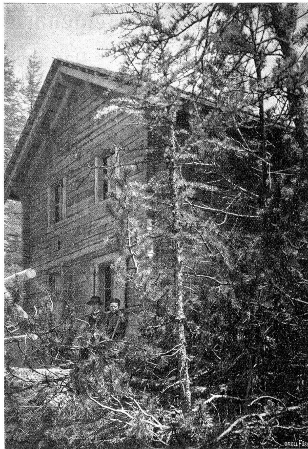
Blockhaus im Val Cluozza.

Das sind aber bis heute die einzigen Wege, die von der Außenwelt in das Schutzgebiet führen und da ist es erklärlich, daß sich besonders die Tiere in dieser hehren Einsamkeit wohl und glücklich fühlen werden. Und damit beginnt auch die Idee, aus dem Nationalpark eine Tier- und Pflanzengemeinschaft zu schaffen, wie sie ursprünglich in der Schweiz eine Heimat gehabt hatte, einer glücklichen Verwirklichung entgegenzugehen. Die Tiere aller Art erfreuen sich einer ungestörten Vermehrung; sie verlieren die Furcht vor den Menschen und wagen sich aus ihren Schlupfwinkeln hervor, und andere Tierrassen werden dort mit der Zeit eine neue Heimat finden.