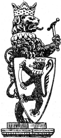
Hauszeichen der Oberberger