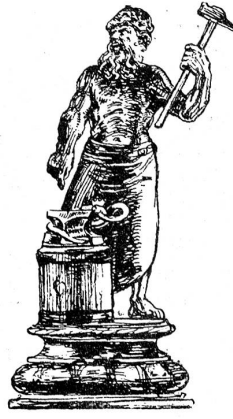
Becher der Schmiede von 1726