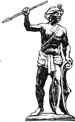
Hauszeichen der Schneider (zum Mohren)