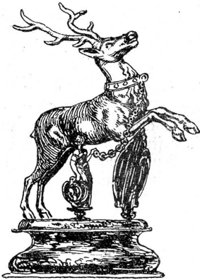
Becher der Pfister um 1700