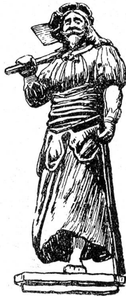
Hauszeichen der Zimmerleute