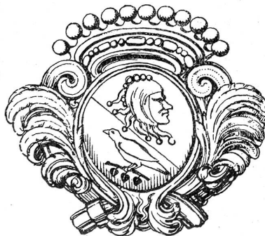
Hauswappen der Stube zum Narren und Distelzwang