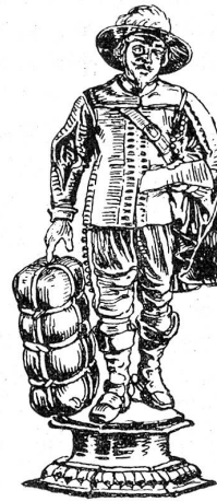
Becher der Kaufleute von 1699