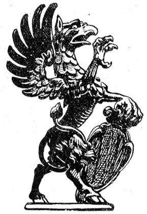
Hauszeichen der Weber

schon um 1450 zusammengetan haben. Weiter bildeten die Weber, die Schuhmacher, die Schneider, die Kaufleute, die Steinmetzen, die Zimmerleute, die Schiffsleute und die Rebleute je eine Stube. 1477 legte die Obrigkeit die beiden Schützenstuben zusammen; doch verliert sich die zunftähnliche Stellung der Schützen rasch, sodaß sie von der Reformation weg sich in nichts von einem modernen Schützenverein unterscheiden. Die Kontingente von nicht weniger als 18 städtischen Gesellschaften zogen nach Murten, ein Jahrhundert später gab es deren noch 14 und seit dem Aussterben der Rebleute Stube im Jahr 1729 noch 13. Seit 1674 billigte man den Adligen zum Narren und Distelzwang den Vortritt zu, ihnen folgen die 5 Wennergesellschaften zu den Pfistern, Schmieden, Metzger, Gerbern und zum Mittelweien, dann die drei Handwerke, welche für die leibliche Bekleidung sorgen, die Weber, die Schuhmacher und die Schneider zum Mohren, die Kaufleute, die zwei Bauhandwerke der Steinmetzen zum Affen und der Zimmerleute, und zuletzt die Schiffsleute. Allmählig bildete sich der Grundsatz heraus, daß ein Sohn in der väterlichen Gesellschaft bleiben konnte, auch wenn er ein anderes als das zünftige oder gar kein Handwerk betrieb; die strengere Zeit hatte nur das Stubenrecht von Handwerks wegen gekannt.