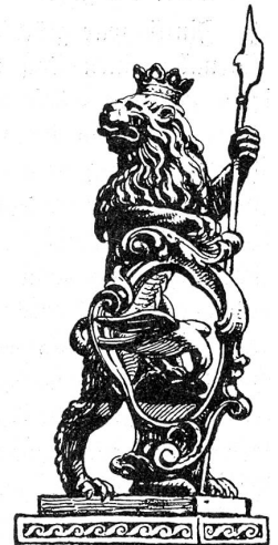
Hauszeichen der Stube zum Mittelleyen