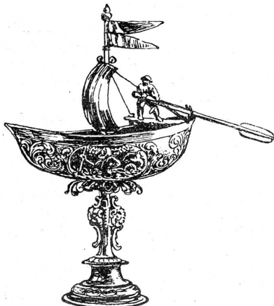
Becher der Schiffsleute, um 1690

Von der Parteien Haß und Gunst entstellt, schwankt der Zünfte Bild in der Geschichte. Das Gute des Zunftwesens,