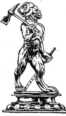
Becher der Steinmetzen (zum Affen) von 1699