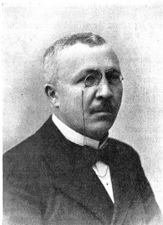
Bundesrichter Dr. Rossel.

Und drittens wurde die Einführung von Postlagerarten mit einmonatlicher Gültigkeitsdauer beschlossen. Die Gebühr für dieselben wurde auf 30 Rp. festgesetzt. Diese Postlagerarten dienen als Ausweis für die Erhebung von postlagernden Briefen usw. Die Karten tragen nur den Poststempel der betreffenden Poststelle und eine fortlaufende Nummer, die statt der Adresse auf den Briefen angegeben werden kann. Es sind das Neuerungen, die sicher nicht nur von der Geschäftswelt begrüßt werden dürften.