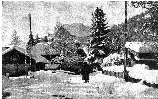
Dorfstrasse in Gstaad.

Unter den vielen Winteraufenthalt- und Wintersportplätzen, die sich in den letzten Jahren im Bernerlande aufgetan haben, gehört Gstaad sicherlich zu den meistversprochenen