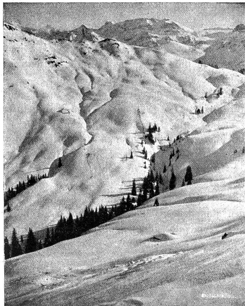
Wysstättgrat, Blick auf Wildstrubel.

Am den hellen Wintertagen aber, wo der Himmel im tiefblauen Kleide sich zeigt und die gerundeten Zinnen und Kuppen der Berge wie eitel Gold strahlen, da ist die Landschaft Gstaad ein Gemälde von einer Größe und Farbenpracht