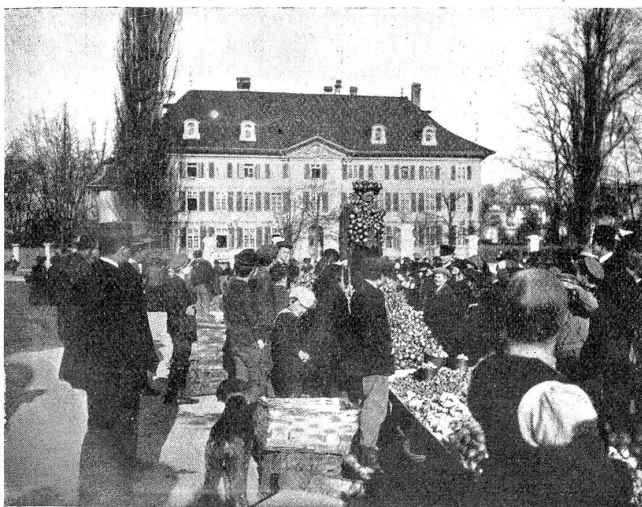
Vom letzten Zybelemerit.

Buntschekige Anschläge an allen Ecken. Blaue, grüne, rote Ballons in der Luft, von Kindern herumgetragen,