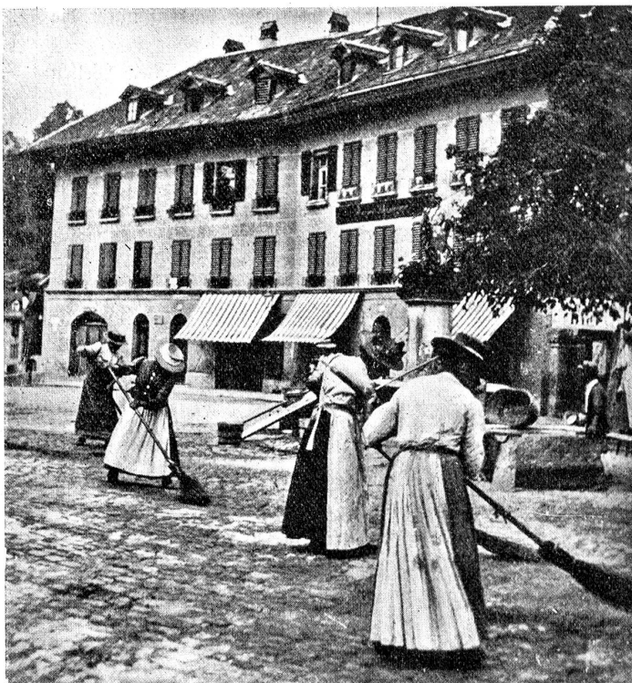
Das „Bernische Streichorchester“ macht Stadttoilette.