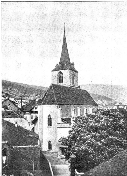
Die alte Stadtkirche von Biel.

Nach langer Unterbrechung ist letzten Sonntag unsere Stadtkirche dem Gottesdienst wieder geöffnet worden. Eine bescheidene Feier mit Festgottesdienst, Reden und Gesängen wurde mit der Einweihung verbunden. Die Stadtkirche hat, wie fast jeder ähnliche größere Kirchenbau, ihre Geschichte. Auch sie hat ihre Leiden und Freuden