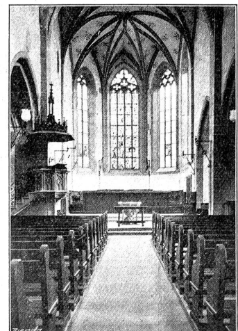
Das Innere der alten Stadtkirche von Biel.

Am Donnerstag, den 28. dies, wird in Luzern der Verwaltungsrat der schweizerischen Unfallversicherung zu einer 2—tägigen Session zusammentreten. Unter den Traktanden sind zu nennen: Die Beratung der Geschäftsordnung, der Bericht über die Einrichtung der Anstalt, die Beratung über die Gestaltung der Direktion, die Bestellung von Kommissionen zum Studium des Finanzhaushaltes und der Erstellung eines Verwaltungsgebäudes. Auch die Motion des Herrn