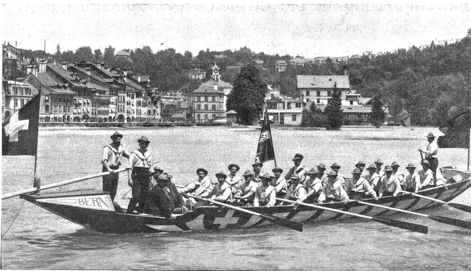
Der Pontonierfahrverein Bern vor seiner Wasserreise nach Köln.

Ein entzückendes Bild für den Freund der Jugend (und der Natur bietet unser „Bu-