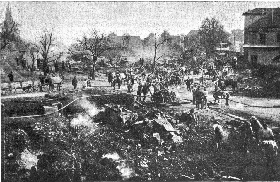
Vom Brandplatz in Hindelbank: Bei der Brennerei Witschi.