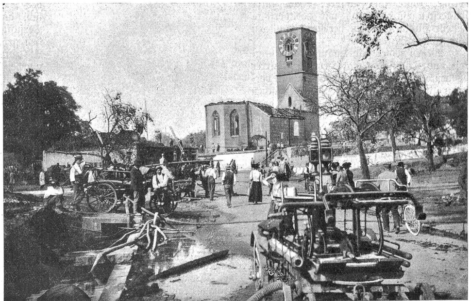
Vom Brandplatz in Hindelbank: Kirche und Umgebung.

Die letztere ist für den Betrag von Fr. 55,500. — versichert. Sie wurde um das Jahr 1515 erbaut und übertraf durch die Kunstdenkmäler, die in ihr eine Stätte gefunden, manchen äußerlich prunkvolleren Bau an Wert. Ueber die Kirche in Hindelbank bringen wir in der nächsten Nummer einen interessanten Aufsatz aus der Feder unseres bewährten Mitarbeiters Dr. A. Zeffiger. Schr.