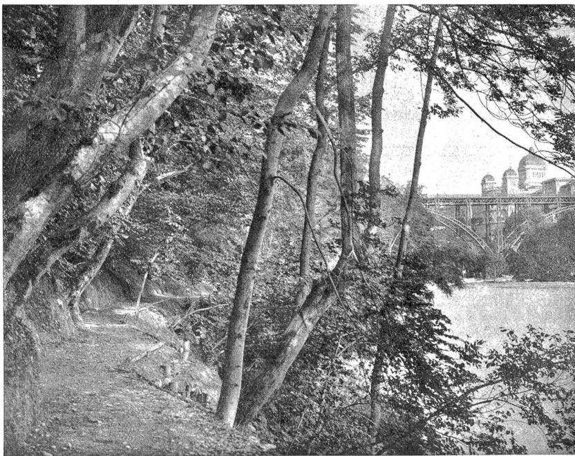
Partie von der Staudenpromenade in Bern.

Alle maßgebenden Parteien bekennen sich zur Sozialpolitik, und alle Parteien, die auf eine Zukunft rechnen, müssen sich mit ihr abfinden; alle starken Parteien im