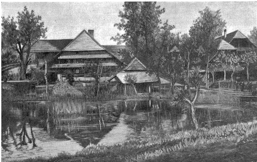
Herzwil. An dem Feldsträßchen von Köniz nach Thörishaus gelegen.

So weit Schwester Arendt über Kinderklaven in Europa. Es gibt noch mildere Formen des Kinderklaventums, als die eben geschilderten, die den Anstoß gaben zu der großen Frauen- und Kinderschutzbewegung unserer Tage. Die zahlreichen Zweigvereine des großen Bundes, der edelgedenkende Menschen zum Schutze der bedrohten Schwachen und Hilflosen verbindet, sind bestrebt, Mißhandlung und Verwahrlosung, Entrechtung und Herabwürdigung, begangen an Frauen und Kindern, in welcher Form sie sich zeigen, aufzudecken, zu sühnen und aus der Welt verschwinden zu lassen. Vor kurzem hat sich ein schweizerischer Verein für Frauen- und Kinderschutz gebildet und in unserm Kanton ist diesem Verein eine große Sektion erstanden. Wir werden später an dieser Stelle von ihrem segensreichen Wirken berichten.