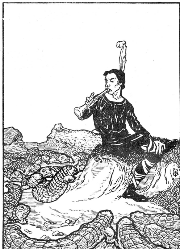
Der Zauberer und die Stollenwürmer.

Lawinsturz und nächtliche Föhnstürme verkörperte es in Geister-Dämonen. Die Kunde von diesen Gefahren, die den Alpenbewohner beständig bedrohen, hielt ja die Menschen der Ebene bis an die Schwelle des 19. Jahrhunderts im Bann; man wagte es nicht, in dieses Land der Abgründe und Gletscherschlünde hinaufzusteigen. Wie schreckhaft noch lauteten die Berichte eines Benvenuto Cellini über das Reisen in dieser Gegend; ein Haller und ein Göthe mußten zuerst schreiben, bevor der Bann gebrochen und der Fremdenstrom zu fließen begann.