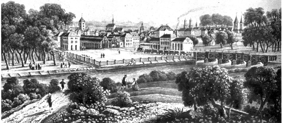
Erster Bahnhof Zürich, aus dem Jahr 1847