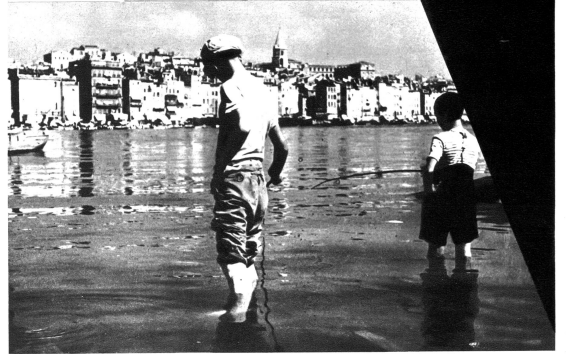
Marsellaner Buben sorgen für Masters Pfanne