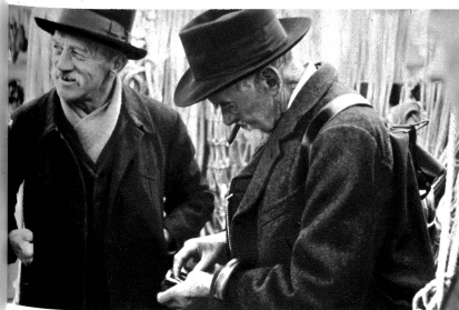
Das isch wieder einisch es guets Seil! Was wotsch drfür?