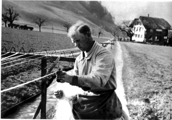
Das Seil wird gezogen