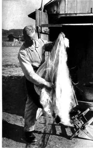
Der Hanf wird gehechelt