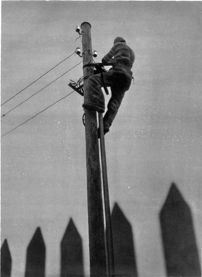
Auch zur Aufstellung der elektrischen Freileitungen braucht es Männer, die gerne zwischen Himmel und Erde verweilen