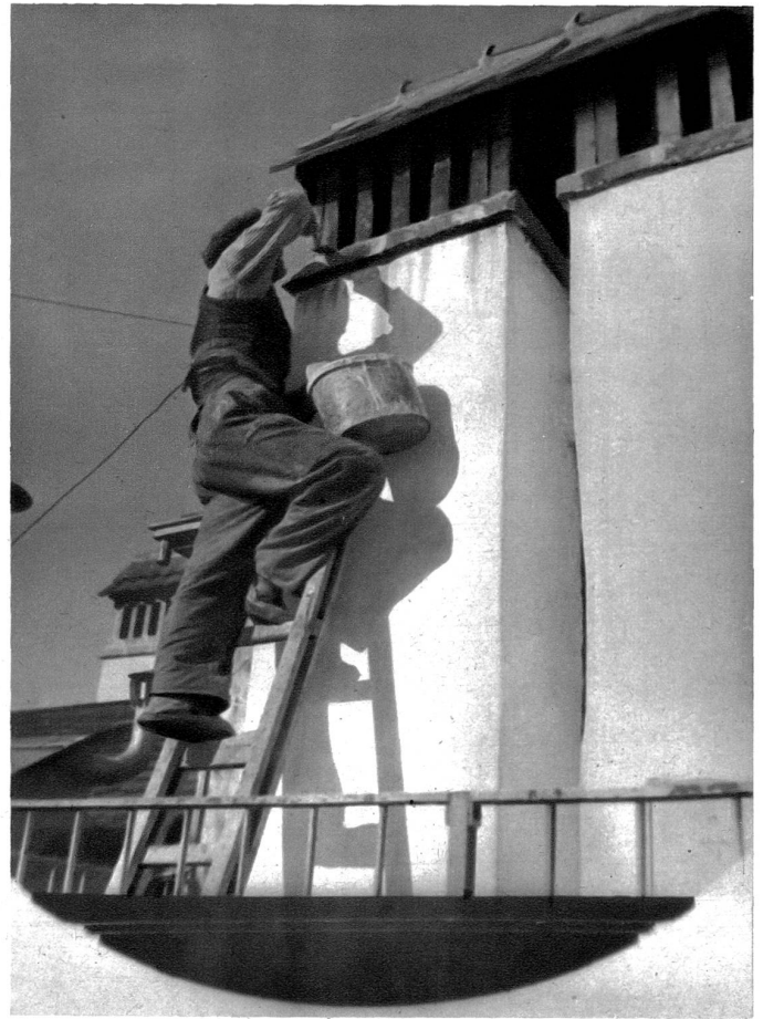
Auf wankendem Steg muss am hohen Kamin der Mörtel angebracht werden