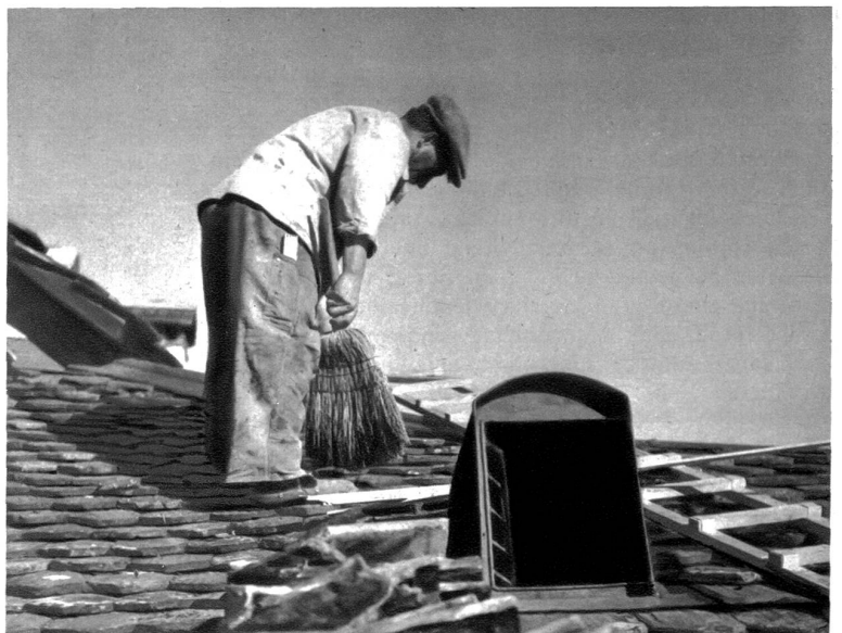
Nicht immer sind die Dächer so flach!