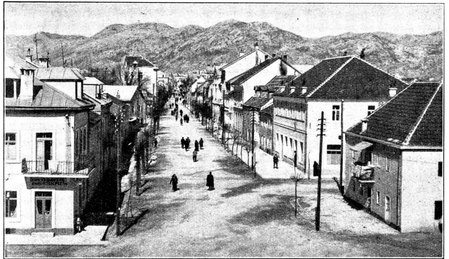
Strasse in Cetinje.

Restaurants solche, und der Montenegriner scheint nach meinen Beobachtungen überhaupt ein leidenschaftlicher Billardspieler zu sein. In das erste und einzige Stockwerk führt eine Doppeltreppe. Die Wände sind mit zahlreichen Bildern und Photographien geschmückt. Die Zimmer vermitteln einen Einblick in das Privatleben des Königs. Anhand der großen Gemälde kann man Ahnengeschichte auffrischen. Alle Porträts früherer Herrscher sind aufgehängt, dazwischen Familienbilder der gut verheirateten Töchter Nikitas. Zwei waren bekanntlich in Rußland, wo sie zu den ärgsten Kriegsheerinnen gegen Deutschland und Oesterreich gehörten. Die italienische Königin ist eine Montenegrinerin. Trotz allem: Der Herrscher über die Cernogoren lebte sehr einfach!