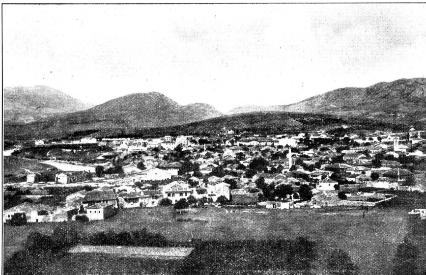
Die montenegrinische Stadt Podgorica.

die Cernogoren in ihrer ganzen Ursprünglichkeit kennen. Der Fremdenverkehr wirkte noch nicht rassererschlechternd und abschleifend. Man trägt die alte Nationaltracht, ist außerordentlich gastfrei. Nirgends reißt man sicherer als hier. Da braucht man nicht Angst zu haben, daß man bestohlen wird. Niksic selber hat 4500 Einwohner, gehört auch erst seit 1878 zu Montenegro. Die pittoreske alte türkische Festung ist noch erhalten. Die stattliche Kathedrale, für das armselige Städtchen fast zu pompös, wurde seinerzeit mit russischem Gelde gebaut, wie ja überhaupt Rußland sich des kleinen Landes vor dem großen Umsturz väterlich annahm. Eine gute Straße bringt von Niksic nach Trebinje im alten Herzegowina, einem ansehnlichen Städtchen mit Schmalspurbahn nach Ragusa. Hier hatten die Oesterreicher bis 1918 stets große Truppenbestände, um das immer kriegerische Bergvolk in Schach zu halten.