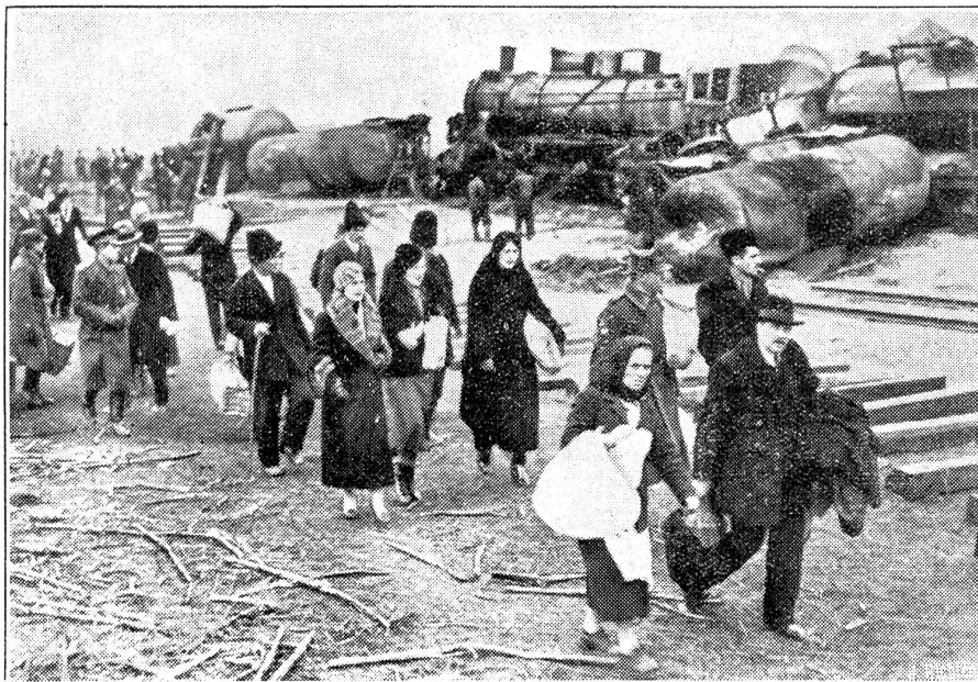
Ein schwerer Betriebsunfall ereignete sich in Rumänien durch den Zusammenstoß von zwei Petroleum-Zügen, die dadurch in Brand gerieten.

liniens höflich-höhnisches „Undenkbar“ den Rat der Aufgabe einer Abstimmung enthebt, so wird das Nein des Rates aus einer Protestwelle der übrigen Welt von selbst fliegen.