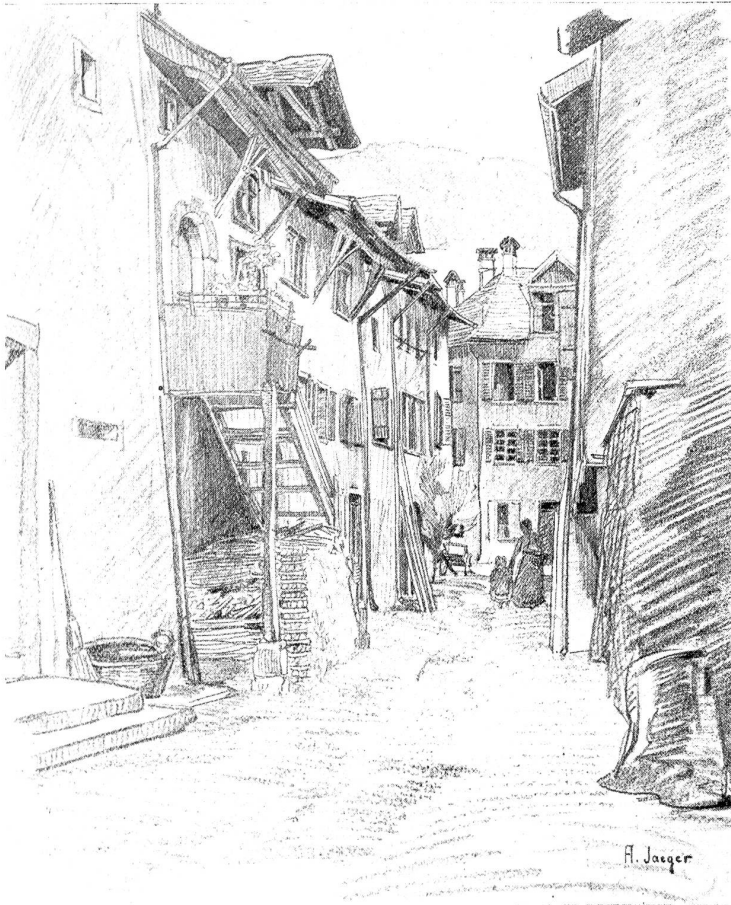
Twann. Die Bärenlante.

starker Naturschilderung. Nie aber wird sein Stil trocken, immer weiß er in den Tatsachenbericht — sei es, daß er Historisches, Kulturhistorisches, daß er Volkswirtschaftliches oder Geographisches aufzeigt — persönliche Erlebnisse einzuflechten. Er bezeugt dabei seine fast rührend begeisterte Naturverbundenheit und seine bekennniswarme Aufgeschlossenheit, die immer wieder J. J. Rousseaus Geist vor uns auftauchen läßt — dem er übrigens in einer lesenswerten Darstellung des Inselerlebnisses mit innerstem Verständnis nachgegangen ist.