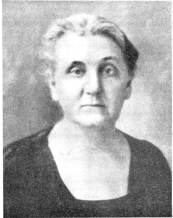
† Jane Addams.

cago die Todesbotschaft. Im Alter von 74 Jahren hat die große Friedensfreundin und Kämpferin, die überragende soziale Wohltäterin nach einem arbeitsreichen, uneigen-