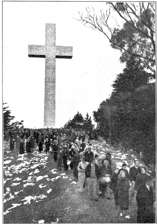
Mt. Davidson in San Francisco, mit dem neuen Kreuz: 30 m hoch 12 m breit. (Nach der Osterfeier 1934.)

eingehalten, ohne daß diesen eine wilde Fastnacht vorangegangen wäre.