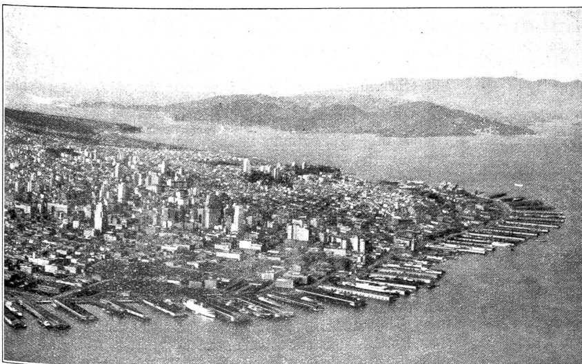
Der nördliche Teil von San Francisco, begrenzt im Westen vom Pazifischen Ozean, im Norden vom Goldenen Tor (Berge von Marin Grafschaft auf der anderen Seite), im Vordergrund die Hafenanlagen mit 45 Piers.

Es gäbe keinen geeigneteren Ort für die Osterfeier der Stadt am Goldenen Tor. Mt. Davidson, ein grüner, teilweise bewaldeter, 300 Meter hoher Berg mitten in San Franzisko, ist die höchste Erhebung der Stadt. Die Aussicht von hier kann keiner vergessen, der einmal