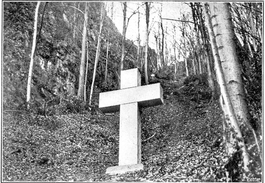
Ein Kreuz am Ort des Todessturzes von König Albert I.

Der deutschen Reichswehr und der Schwerindustrie, den Herren des Dritten Reiches, fällt die Antwort auf die britisch-französische Einladung schwer, aber noch schwerer muß sie den Führern der nationalsozialistischen Regierung fallen. Jene könnten unter Umständen, wenn kein Ausweg übrig bliebe, die verschiedenen geforderten Verzichte unterschreiben: Verzicht auf Oesterreich, Verzicht auf eine offensive Politik gegen Osten, Verzicht auf die Hoffnung, auch im Rheinland wieder bewaffnete Garnisonen und Festungen zu unterhalten; die Hitlerbewegung aber hat sich in ihren Zielen weit hin verrannt und kann nicht so leicht krepfen. Die Reichswehr könnte einen Verzicht aussprechen und einen Hintergedanken verfolgen, ohne daß das Prestige damit veran wäre; man hat sich nicht vor der ganzen Nation verpflichtet. Aber Hitler hat geschrieben, gesprochen und versprochen. „Einigung aller Deutschen“ ist ein Ziel, das man nicht annullieren darf; man kann also die Unabhängigkeit Oesterreichs nicht anerkennen, wenigstens nicht in ehrlicher Absicht. Man kann auch nicht einen „Ostpakt“ unterzeichnen, in welchem den Russen ihre