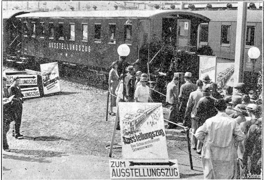
Der erste schweizerische Ausstellungszug beginnt seine Propagandareise.

Der erste schweizerische Ausstellungszug, eine fahrende Schau schweizerischer Industrieprodukte, steht fahrbereit im Zürcher Hauptbahnhof und wird seine Reise nach allen grösseren Orten des Landes antreten. Es ist das erste Mal, dass sich die Bundesbahnen in Verbindung mit einer Propagandagenossenschaft in den Dienst der schweizerischen Warenpropaganda stellt. Der erste schweizerische Ausstellungszug erfreut sich (wie unser Bild zeigt) eines grossen Publikumsbesuches.