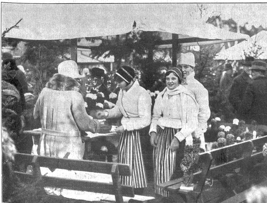
Weihnachtsmarkt in Stockholm

Das Julfest; so heißt Weihnachten, das Fest Christi Geburt, in Schweden! — ist in dem Lande der Mitternachts-sonne seit den undenklichsten Zeiten das größte Fest des Jahres. Seine Geschichte und Tradition reicht bis weit in die vorgeschichtliche und heidnische Zeit zurück, wo man noch die Wiederkehr der Sonne und das Längerwerden der Tage nach der Sonnenwende feierlichst beging. An diese Zeit erinnern besonders die Sternfänger, weißgekleidete, von Haus zu Haus ziehende, uralte deutsche Weihnachtslieder singende Knaben, mit einer Krone auf dem Kopf und Laternen in Sternform in der Hand, zu denen sich meist St. Nikolaus oder der Weihnachtsmann gesellt, der Gaben für die Armen in den Wohnungen und auf den Straßen sammelt. Ja, die Straßen. Man erkennt sie zur Weihnachtszeit gar nicht wieder. In jeder Groß- und Kleinstadt lebt sich in ihnen der traditionelle Weihnachtsmarkt