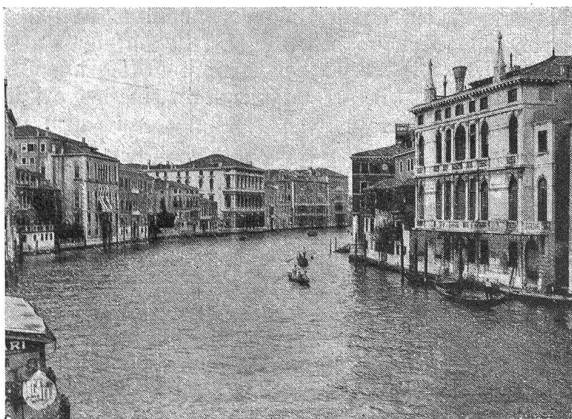
Venedig. Canal Grande.

gressist ein feines Krämlein als Andenken nach Hause gebracht. Ob wohl jeder Käufer das Erworbene an der Grenze auch verzollt hat? Der Samstagvormittag endlich war bestimmt für die Besichtigung der modernen Hafen- und Fabrikanlagen von Marghera. Ein neues, zukunftsreiches Venedig ist hier neben dem alten aus seiner glorreichen Vergangenheit entstanden und liefert einen eindeutigen Beweis dafür, daß Italien unter seinem willensstarken Duce zu neuer Zeit erwacht ist. Daß die Kongressisten in freien Stunden einzeln und gruppenweise die Markuskirche, den Dogenpalast, die Kunstakademie und weitere Sehenswürdigkeiten der kunstreichen Stadt besuchten, braucht wohl kaum erwähnt zu werden. Mancher einer hat auch nicht unterlassen, am frühen Morgen den zutrau-