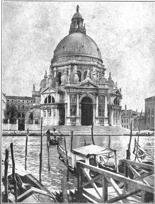
Venedig. Santa Maria della Salute.

saal arbeiteten an einer Tischdecke nicht weniger als 8 Arbeiterinnen; erst in einem Viertelsjahr soll das Kunststück fertig sein. Von Murano und Burano hat manch ein Kon-