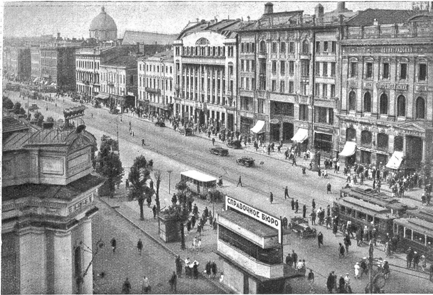
Prospekt des 25. Oktober, früher Njewskij-Prospekt. Im Vordergrund ein Verkehrsturm, von dem aus der Verkehr der Hauptstrasse mit einer Seitenstrasse geordnet wird.