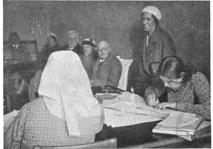
In einem Sowjetbureaußin Leningrad. Eine Mutter meldet ihr elftes Kind an. Die junge Frau rechts registriert das Kind. Sie registriert auch die Ehepaare, die sich bei ihr einfinden. Stehend: eine Intourist-Führerin. Sitzend: Passagiere der „Oceana“. (Siehe die Skizze „Wie der Russe heiratet“.)

erhält einen Brief, er habe sich nicht mehr als verheiratet zu betrachten. Das Gericht ist vollständig ausgeschaltet. Ein Grund, die Ehe aufheben zu wollen, braucht nicht ge-