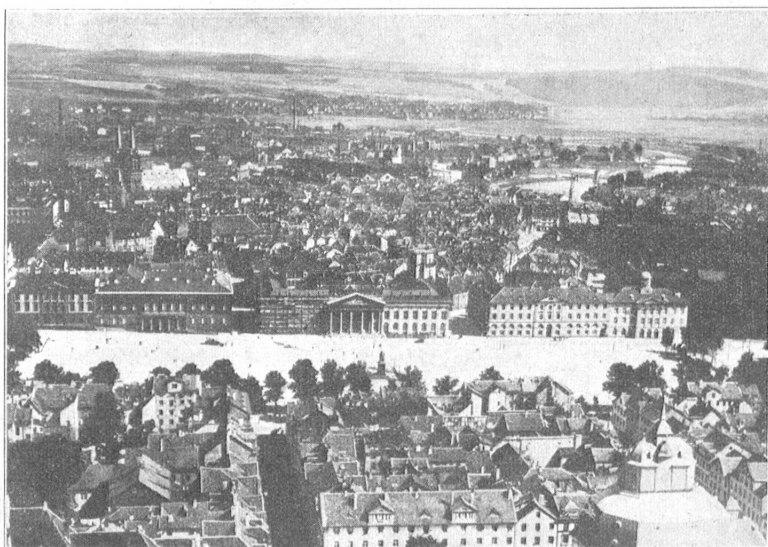
Kassel. — Friedrichsplatz (Luftbild).