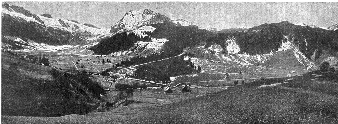
Der Calboden Innertal vor dem Ebnat, aus Südosten gesehen.