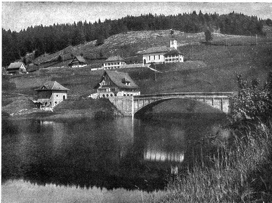
Neu-Innertal mit Kirche, Pfarrhaus und Schule der Architekten Müller & Freytag, Calwil.

Das Hauptinteresse am damaligen Bauvorgang nahm die gewaltige, 110,5 Meter hohe Staumauer im Sährä, einer schluchtartigen Verengung des Wäggitales, in Anspruch, durch die der ungefähr 5 Kilometer lange und maximal 1,2 Kilometer breite Stausee Innertal entfiel. Das Gesicht unserer Heimat erfuhr dort eine einschneidende