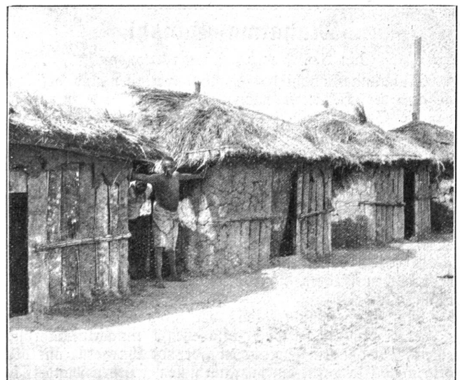
Negerdorf in Marromeu.