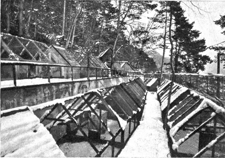
Pelztierfarm Beatushöhlen am Thunersee: Silberfuchsgehege.

Sie diese Sache probieren, wenn ich Ihnen die nötigen Hinweise dazu geben würde?“