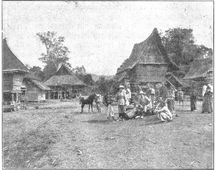
Ein Ausflug in ein Batakkerdorf auf der Karo-Hochfläche.