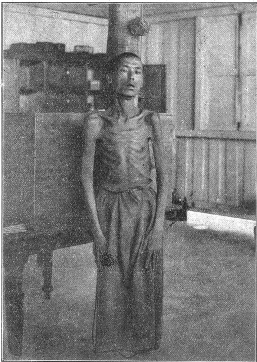
!Kranker Chinese im Spital.

Wenn sich uns auch kein Cäsar in den Weg stellte, hatten wir vorerst genugsam mit Hindernissen zu kämpfen; denn ein fremder Administrateur, der an Verfolgungswahn