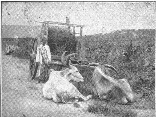
Graskarre. Bengalische Ochsen. Kartoingena, javanische Auffscherin.

Sie lächelte verschämt, war reizend, legte mir den Finger auf den Mund, und wir herzten einander und schloßen lästiglich ein; gerade wie bei meiner lieben Mutter, deren warme Stimme meine Nerven auch stets beruhigt hatte wie ein laues Bad. Wir waren so angenehm müde, daß wir des Tuanfu, der in der Einbildungskraft meiner Simujah wohl die Rolle des schreckhaften Begu spielen mochte, völlig vergaßen.