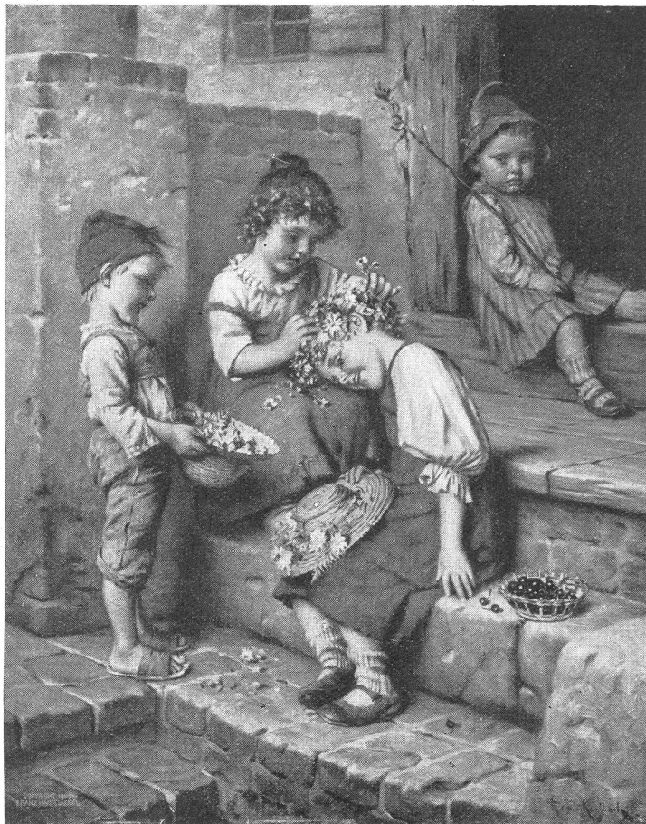
H. Kaulbach: Der Blumenkranz.

Wie macht sich, kurz gefaßt, die Blütenbefruchtung? Die in den Staubgefäßen (Staubbeutel) der Blüten lagernden sogenannten Pollenkörner (Blütenstaub) keimen, auf die Stempelnarbe der Blüte gebracht, die sogenannten Keimschläuche, diese dringen durch den Stempelstand hinab und gelangen in der sogenannten Eizelle (den Samenanlagen) zu befruchtender Entleerung. Also an und für sich ein einfacher Vorgang (und doch wieder ein wunderbares subtiles Naturspiel) und es wäre bei der Pollenmenge der Blüten kaum an ein Fehlschlagen der Befruchtung bei günstiger Witterung zu denken. Doch auch hier gibt es noch andere bedingende Faktoren für gutes Gelingen. Daß z. B. die