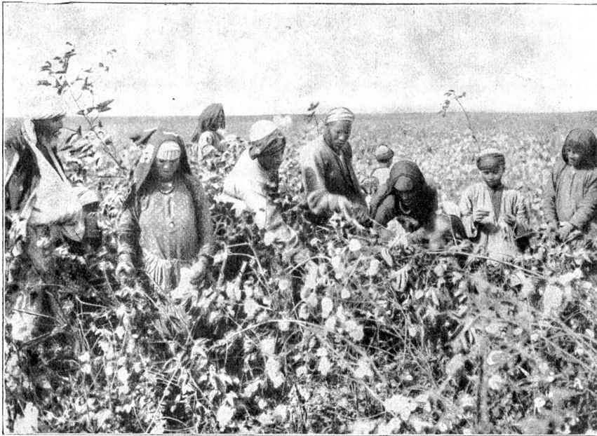
Baumwollernte in Ägypten.