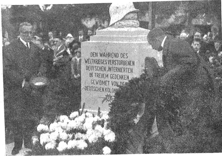
Einweihung eines Internierten-Gedenksteins.

Im Bremgarten-Friedhof in Bern wurde zur Erinnerung an die während dem Weltkrieg in Bern verstorbenen deutschen Internierten ein schlichtes Denkmal eingeweiht. — Feierliche Anziederlegung.