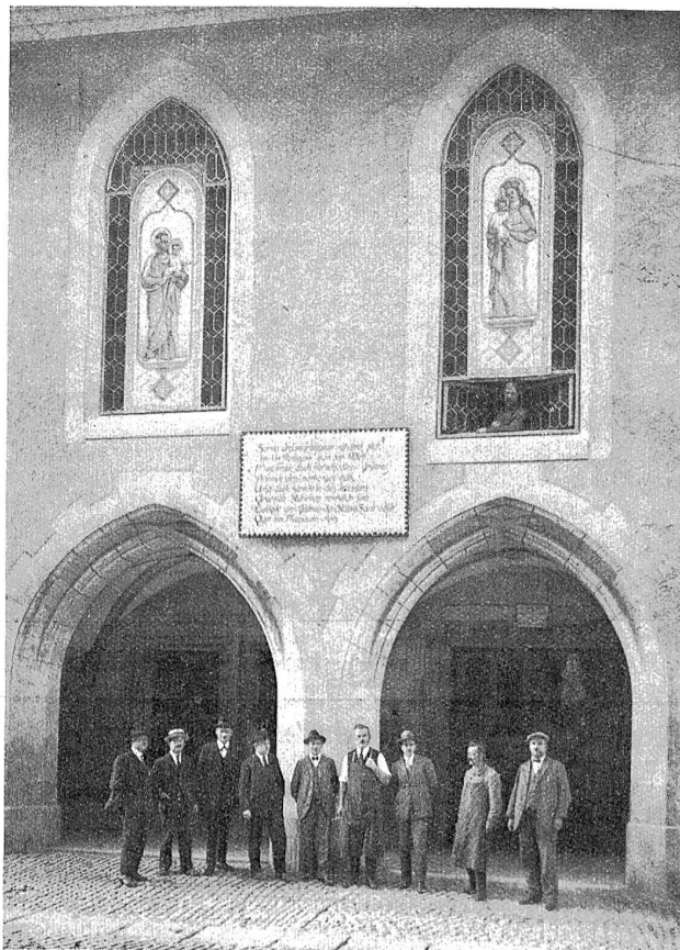
Das ehemalige St. Antonierkloster an der Postgasse in Bern und die Vorstandsmitglieder des heutigen Postgäßleistes.

Die Kirche selbst ruht auf gotthischen Bögen, welche nach bernischer Bauart die durchlaufenden Lauben bilden. Dieselbe ist durch zwei Kreuzgewölbe überspannt und die innere Wand von zwei Eingängen in die Kirche durchbrochen. Zwischen den Kreuzgewölben ist ein Wappenschild mit dem „T“ des Ordens angebracht. In der Arkadenwand zwischen den Türen ist eine kleine Nische zur Aufstellung des Heiligen und des ewigen Lichtes. Dies ist wohl das einzige erhaltene Straßenaltärfchen des alten katholischen Berns. Im Innern der Kirche sind noch Spuren einiger Wandmalereien bemerkbar, die aus dem 15. Jahrhundert stammen dürften. Die jetzigen Balkenlagen sind spätere Zutaten und trugen viel zum Ruin der erwähnten Fresken bei. Alle noch am Gebäude erhaltenen Formen zeigen den Charakter der späteren Gothik. Nach der Reformation wurde die Kirche zu einem Kornhaus umgewandelt, später wurde der Mueshafen dorthin verlegt, noch später diente sie als Postwagenremise und 1839 sogar als Antiquitätensaal. Heute ist sie, wie ebenfalls schon erwähnt, teils Feuerwehrgeräteschuppen und teils Rumpelkammer.