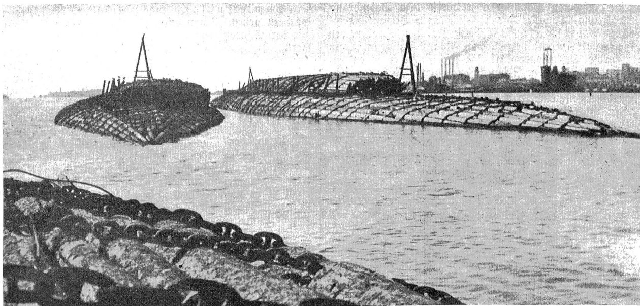
Riesenflöße in San Diego (Kalifornien) von 250 m Länge und 16 m Breite, die mit 175 Connen Stahlketten zusammengehalten werden.

kämpfe abgehalten. Die hierauf haftende Buße wird stillschweigend bezahlt und kein Hahn kräht danach; der Diana-tempel, ganz in Marmor erbaut, ist größtenteils zerfallen, dagegen steht noch auf einem Hügel dicht an der Stadt der mächtige „Tour Magne“, vor der Römerzeit erbaut mit wunderbarer Aussicht auf den größten Teil des Departements. In Montélimar kauften wir uns noch rasch vom Zuge aus einige Schachteln des berühmten Rougat, um wenigstens unsern Lieben zu Hause ein Andenken an die Afrikareise überreichen zu können. Nachts 11 Uhr folgte noch die ekkige Zollpladerei in Bellegarde bei strömendem Regen, jedoch endlich, etwas mürbe und reisemüde, aber voll der schönsten Erinnerungen, das Wiedereintreffen in unserm lieben Bern. (Ende.)