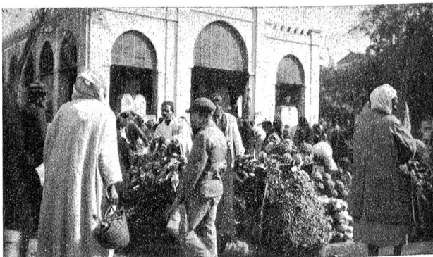
Gemüsemarkt mit Markthalle in Tunis.

Rechnen wir die damalige Bevölkerung der Stadt Bern zu 7000 Seelen, so kommt auf jeden Bewohner per Stunde