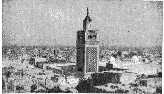
Blick auf Tunis und die große Moschee.

ein Wasserquantum von nur 2,4 Liter aus der öffentlichen Quellwasserversorgung. Es ist daher begreiflich, daß die