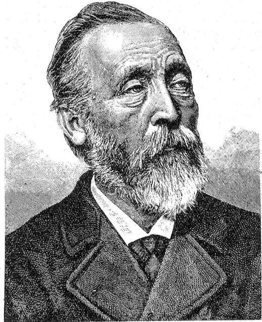
Heinrich v. Stephan, erster deutscher Generalpostmeister, der die Gründung des Weltpostvereins mit aller Energie anstrebte.

Stand“, d. h. die Korporation der jungen Berner Patrizier, als deren Rathhaus erbaut worden ist, und das 1798 als Versammlungsort der Tagsatzung, dann des