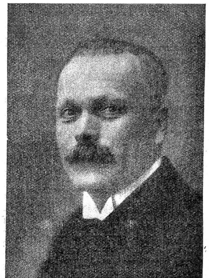
Ernest Chuard, Vizepräsident des Bundesrates für das Jahr 1923.

In der zweiten Sessionswoche befaßte sich der Nationalrat mit der Fortsetzung der Diskussion über das Militärbudget. Die linksstehenden Parteien benötigten diesen Anlaß, um für den Antimilitarismus und die vollständige Abrüstung zu demonstrieren. Trotzdem aber wird jeder Einsichtige verstehen, daß ein kleines Land wie die Schweiz, inmitten des aufgewühlten Europas nicht auf sein bescheidenes Milizheer verzichten kann, wenn es nicht eine Beute des allgemeinen Chaos werden will. Uebrigens waren