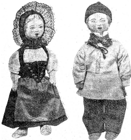
Stoffpuppen von Hed. Dietzi-Bion, Bern.

figen Kopf! Bald erlahmen die Kinderarme, auch schaut die Mutter beständig mit mahnendem Blick her und ruft: „Gib acht zu der schönen Puppe! Laß sie ja nicht fallen! Setze sie schön in die Sophaede, du kannst sie ja auch so anschauen. Ueberhaupt ist das eine Sonntagspuppe. Spricht's und trägt die Puppe wie ein schweres unbehülfliches Kind weg.“