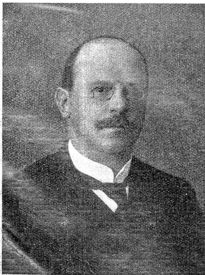
Karl Scheurer, der neue Bundespräsident für das Jahr 1923.