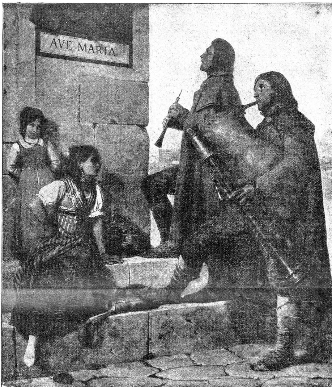
Leopold Robert: Pflifferari vor der Madonna. — (Im Kunstmuseum zu Vevey.)

Roberts letztes großes Unternehmen war ein Zyklus von vier Bildern, die die Jahreszeiten und die charakteristischen Gegenden Italiens darstellen sollten. Das erste Gemälde dieses Zyklus war «La Fête de la Madone del' Arc»; es sollte Neapel und den Frühling zur Darstellung bringen. Das zweite wurde «Die Ernte in den Pontischen Sümpfen», Rom und den Sommer darstellend. Das dritte, «La Vendange», zeichnete Florenz und den Herbst, und das vierte endlich sollte Venedig und den Norden Italiens verherrlichen. Die zwei ersten Gemälde wurden für den Palais Luxembourg in Paris erworben; sie sind heute im Louvre. Für seinen «Karneval von Venedig» reiste er nach Venedig. Er unternahm mehrere Exkursionen in die Umgebung Venedigs und suchte und fand hier die Modelle zu seinem Gemälde. Er wurde besonders von den Fischern in Chioggia angezogen, und er arbeitete einige Wochen in ihrer Mitte. Die Frucht dieses Aufenthaltes war das oben erwähnte «Die Abfahrt der Fischer in der Adria», sein letztes großes Werk. Melancholie ergriff den Künstler; in Venedig nahm die Krankheit rasch zu; er fiel in tiefe Depressionen und faßte Selbstmordgedanken. In einer solchen Krise konnte er sich der Wachsamkeit seines Bruders entziehen und sich den Tod geben, dies geschah am 25. März 1835.