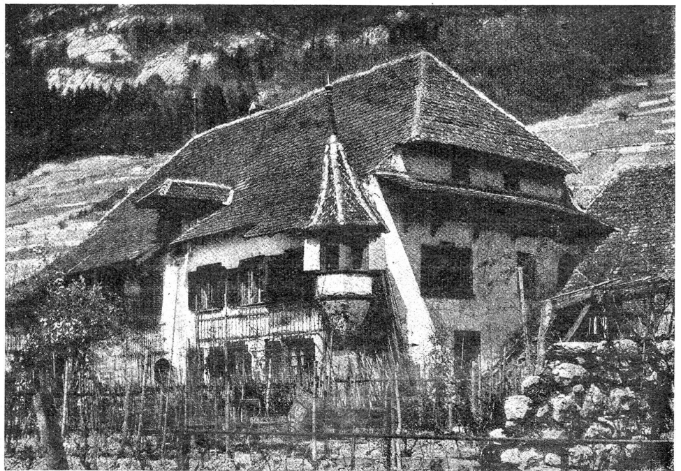
Ligerz am Bielersee. „Der Hof“. (Vergl. den Aufsatz S. 545.) Ehemaliger Sitz der Junker von Ligerz 1545. (Druckstock aus „Die alte Schweiz“.)