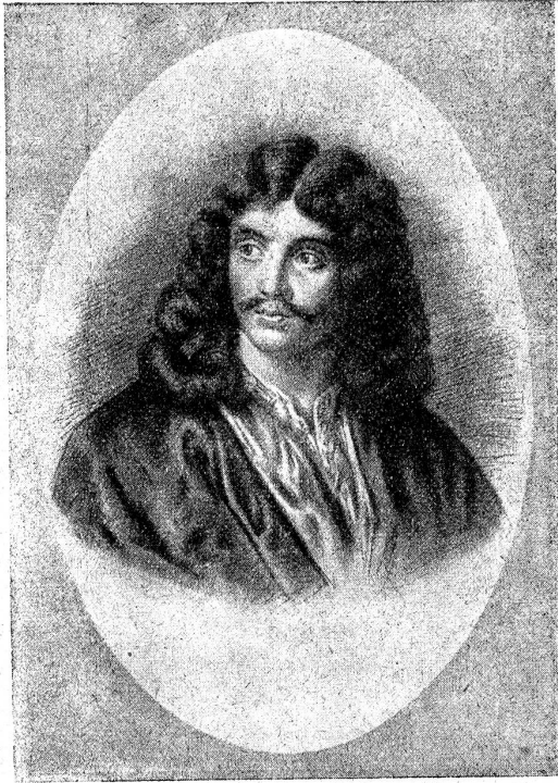
J. B. Poquelin (Molière).

recht in die Augen fallend. Was geht uns denn diese armselige Erde an? fragen die Beschauer. Aber laß sie nur reden. Dann ein rissiger, knorriger, krüppeliger Stamm,