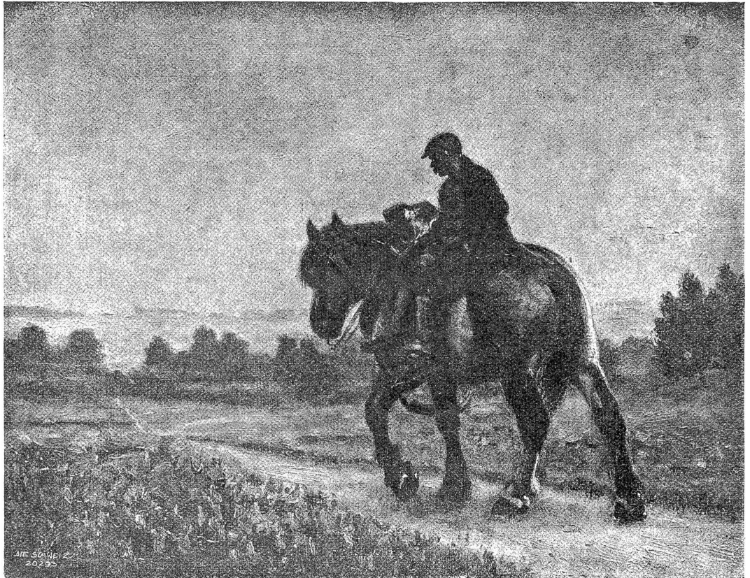
E. Ganz. — Rückkehr von der Arbeit.

Als er seinen dreißigsten Geburtstag feierte, bezog er den Tempel. Pferde, Automobile oder Dienerschaft brauchte er keine; es genügte ihm die alte Köchin und der vertraute