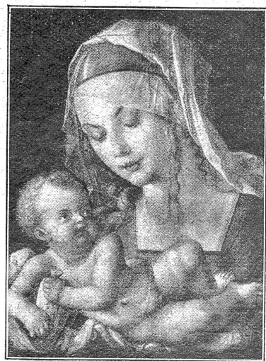
Madonna. Von Albrecht Dürer.

Gegenstände sind so liebevoll und sachlich korrekt dargestellt, wie man sie von einem Interieur-Architekten nicht genauer verlangen könnte. Nicht minder aufschlußreich sind seine Landschafts- und Städtebilder; gewöhnlich sind sie als Hintergrund zu einer Madonna oder einem Heiligen gedacht. Das mittelalterliche Dorfbild, mit den breit herabhängenden Strohdächern, mit Dorfbrunnen, Teich, Zäune, Feldweg liegt vor uns im Blatt: „Die große Kanone“. Nürnbergs Mauern und Türme und spitzgieblige Bürgerhäuser hat er ungezählte Male gezeichnet, aber in freier Zusammenstellung des Typischen und in der Ausschaltung des Zufälligen. Wir