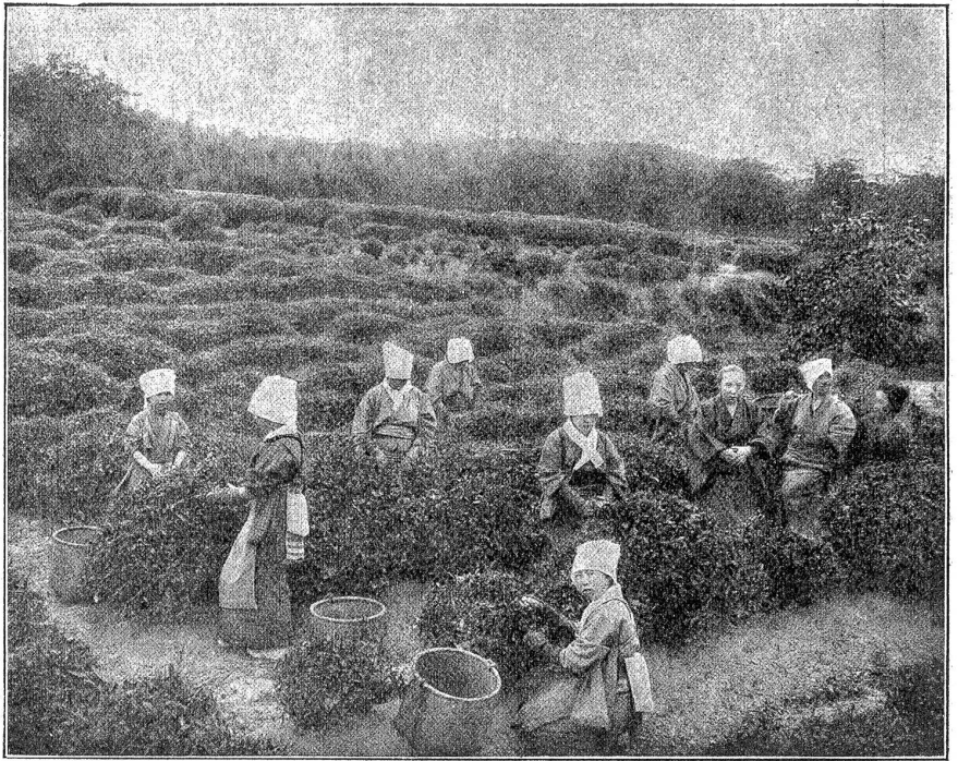
Tee-Ernte auf einer großen Teeplantage in Japan.

Sankau, die am Jangtse gelegene volkreiche Stadt, gilt als Mittelpunkt des chinesischen Teehandels, denn die Mehrzahl der Teeplantagen befindet sich im Gebiet des Riesentromms. Die Herrichtung geschieht auf ähnliche Weise, wie auf Ceylon, nur daß die emsigen Chinesen die Handarbeit, statt jener mit Maschinen, bevorzugen, und daß sie dem Tee, nachdem er getrocknet und sortiert ist, Jasmin-, Rosen-, Gardenien- und ähnliche wohlriechende Blüten, natürlich in vorsichtigem Maße, beimischen, um ihm einen von