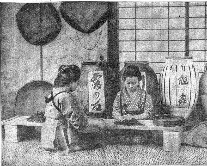
Tee-Sortieren in Japan.

Schlumm ist es, daß die Menschen husten müssen, wenn ihnen etwas Unrechtes in die Kehle kommt; müßten sie aber auch husten, wenn ihnen etwas Unrechtes aus der Kehle kommt, so wäre des Hustens gar kein Ende.