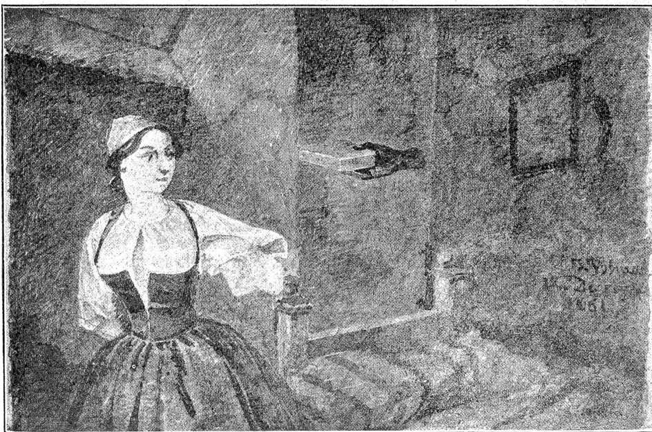
J. Volmar (1796—1865): Spukhaftes aus Bern-Altstadt.

Einer Magd erschien jedesmal, wenn sie abends in ihre Kammer ging, aus einer Mauerecke eine schwarze Hand, die ihr ein schön-gearbeitetes Schmuckkästchen darreichte. Die Magd nahm es aber nie.