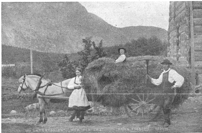
Beimfahrt vom Heuen in Saetersdal (Norwegen).

Der norwegische Bauer hat den kühlen Blick, den elastischen Gang, die lange Rede und die aufrechte Haltung eines Königs im Arbeitsrod. Sie sind auch und waren immer Könige in ihrer Art: frei und wohlhabend, von oft überraschender autodidaktischer Bildung, seit Jahrhunderten auf der ererbten Scholle wohnend. Sie waren im nordischen Altertum jene „Jarle“, die mutigen, trotzig Fürsten, die aus den abgelegenen Fjorden in alle Länder erobert ausströmten, sobald in einer Familie zu viele Söhne waren. Diese Bauern haben stolze Dynastien zu verzeichnen; sie sind gegen den Touristen wohlwollend, schweigsam, gast-