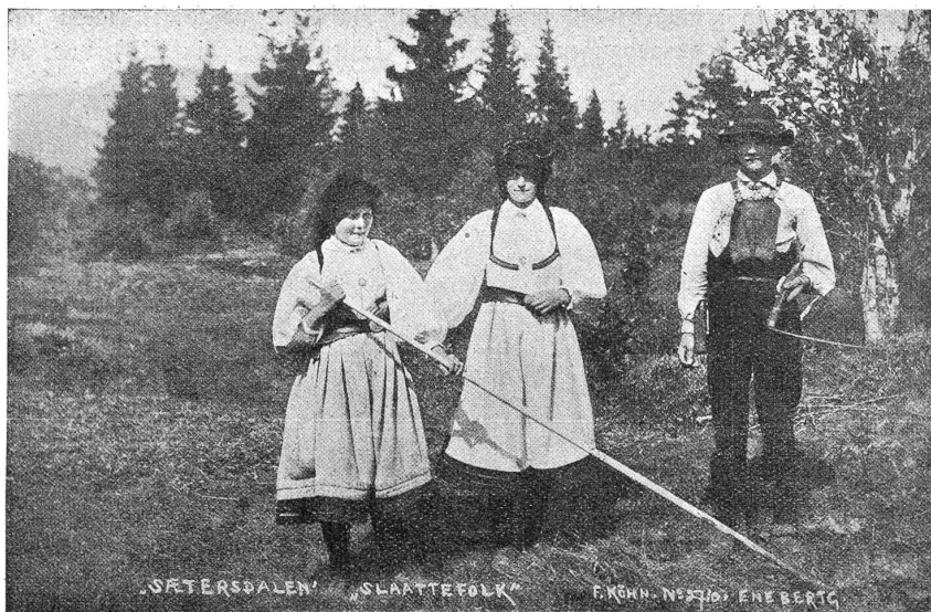
Beim Heuen in Saetersdal (Norwegen).

Aber die Magd erwischte die Zange und den Handhammer.