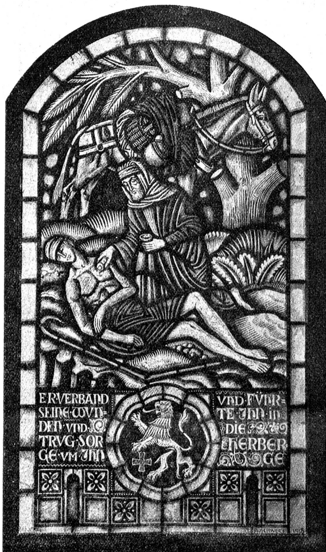
Der barmherzige Samariter, Glasgemälde in der Kirche zu Lahr (Westertal). Entworfen von Albin Scherl, Ramsen (Schaffhausen). Ausgeführt durch Albert Zentner, Glasmaler in Wiesbaden.

„Du mußt nur recht probieren. Faß an einem Zipfel an. Vielleicht ist es auch gar nichts Schlimmes.“